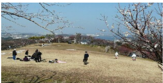
田浦梅林の紅梅を見ながら昼食を

で気兼ねせず写真撮影し、兼ねずみ、光の方、お花の写真を撮りました。手の方、お花の写真を撮りました。教会の方、お花の写真を撮りました。祭りの方、お花の写真を撮りました。お花の写真を撮りました。