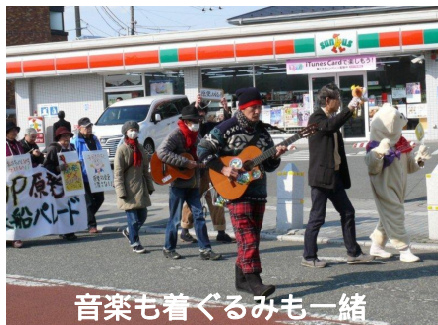
音楽も着ぐるみも一緒