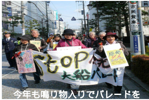
今年も鳴り物入りでパレードを