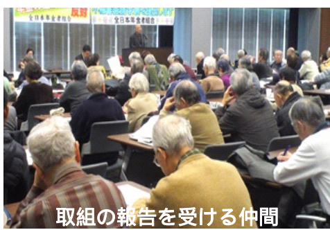
取組の報告を受ける仲間

自民党2人、民主党2 人、結いの党1人の5人 に要請しましたが、国会 の委員会の開催中で議員 に要請しましたが、国会