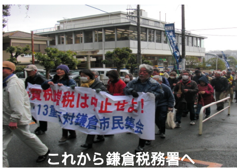
これから鎌倉税務署へ