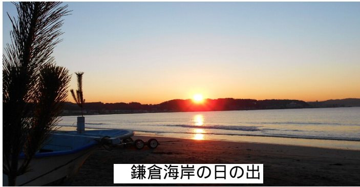
鎌倉海岸の日の出

安倍首相は新年の記者会見で述べました。「賛否両論は激しいだろうが、公約どおりに憲法「改正」にまい進する」と。いよいよ憲法をめぐって「戦争する国づくり」攻防の幕が切って落とされまし幕が切って落とされまし。どんな戦争も国民の意思がその支えとなりま。安倍内閣閣僚一九人中一六人が右翼組織「日本会議」や「神道政治議員連盟」に属しているそうです。国民はその餌食