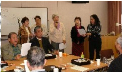
合同新年会で「夕鶴」の朗読

1月26日、三浦ブロック（鎌倉、逗子葉山、横須賀、三浦の4支部）の合同新年会がベルク横須賀で行われました。